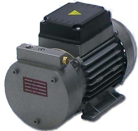
3 S (150 mbar)