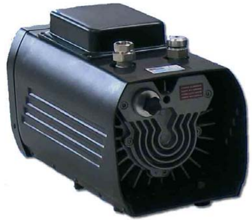
40 S (150 mbar)